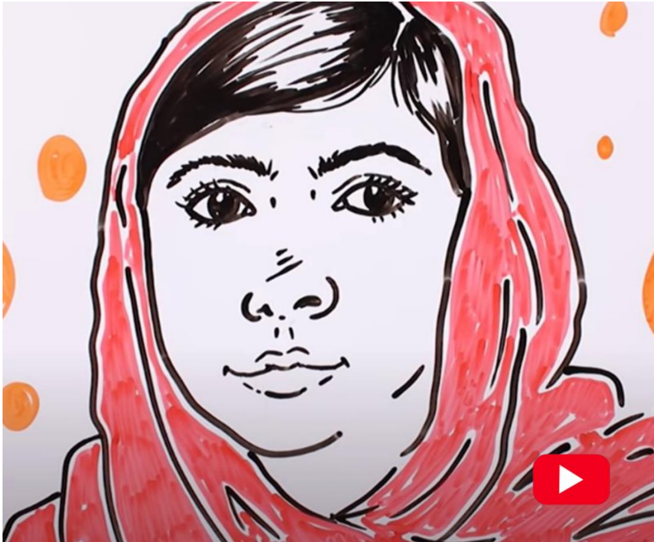
马拉拉·优素福·扎伊