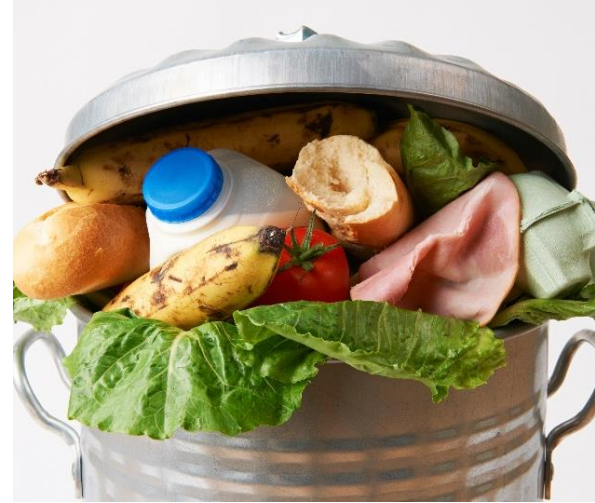
丢进垃圾桶的食物